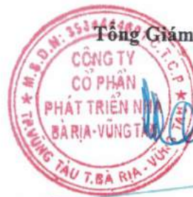
Đoàn Hữu Thuận